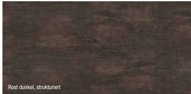
Rost dunkel, strukturiert