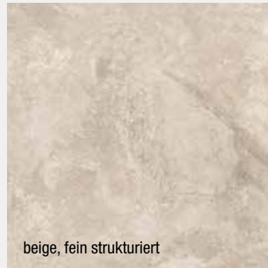
beige, fein strukturiert